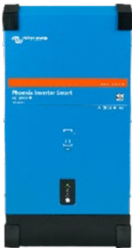
Inversor Smart 12/3000